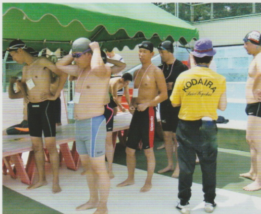
レース前の選手の確認