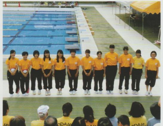
競技委員をして下さった小平高・小平南高の皆様