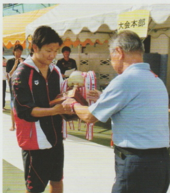
高校男子団体優勝 小平南高校