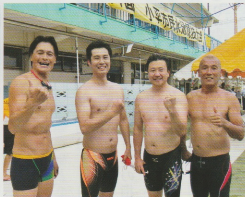
ピーブルー橋チーム