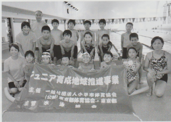
平成29年度 ジュニア選手強化合宿に参加した皆さん