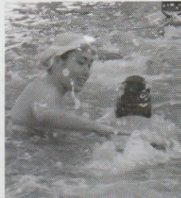
キックを指導している 青田先生