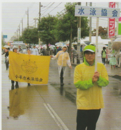
市民まつりパレードに参加

10月15日(日)市民まつりのパレードに、小平市水泳協会が参加しました。あいにくの雨でしたが、水泳協会を知っていただくとうと、あかしや通りを練り歩きました。 次年度は、是非、大勢の皆さんでパレードに参加しましょう！