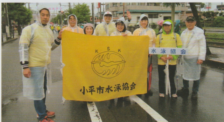
雨の中、参加した皆さん